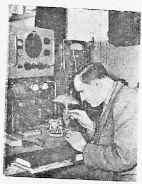
Киев. Экспериментально-производственный отдел института физики Академии наук Украинской ССР освоил серийное производство полупроводниковых приборов. Среди них есть похожие на большую пугонку, прямоугольные, величиной со спичечную коробку и совсем маленькие серебристо-серые квадратные пластинки с проволочками-усиками. Это фотоэлементы — миниатюрные подобия электрических станций, где топливом служит свет. Они являются необходимой деталью в любых автоматических устройствах. Тысячи фотоэлементов с маркировкой института отправляются в различные концы Советского Союза.

П. СЛЕСАРЧУК. Учащаяся группа дорожных мастеров.